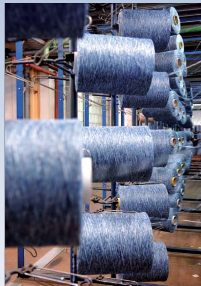
Een selectie klossen met garen die naar de tuftmachine gaan

stellen doen om duurzaamheidsverbeteringen door te voeren. Die kunnen variëren van verbeterde procesinstellingen tot efficiënter omgaan met licht en water. Heeres: "Een voorbeeld van een al gerecenseerd verbetervoorstel is dat van de kwaliteitstesten. Hiervoor werd vroeger altijd een grote reep uit een rol gesneden. Door dit te beperken tot een echt teststukje, besparen we op afval. Verder werken we op onze site met 100 procent groene elektriciteit. Energie die voor een deel door onszelf wordt opgewekt met behulp van zonnepanelen."